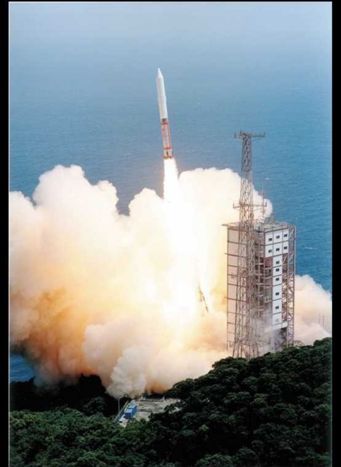
「はやぶさ」の 打ち上げ