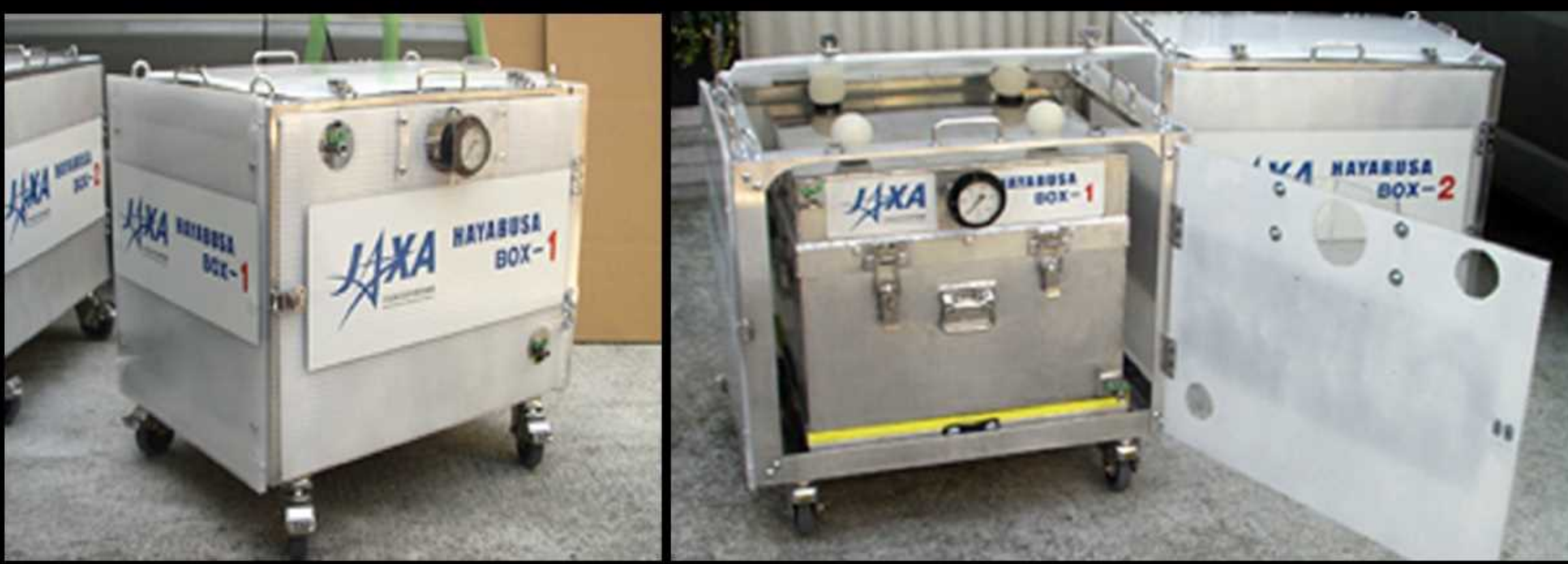
▲「はやぶさ」回収ボックス