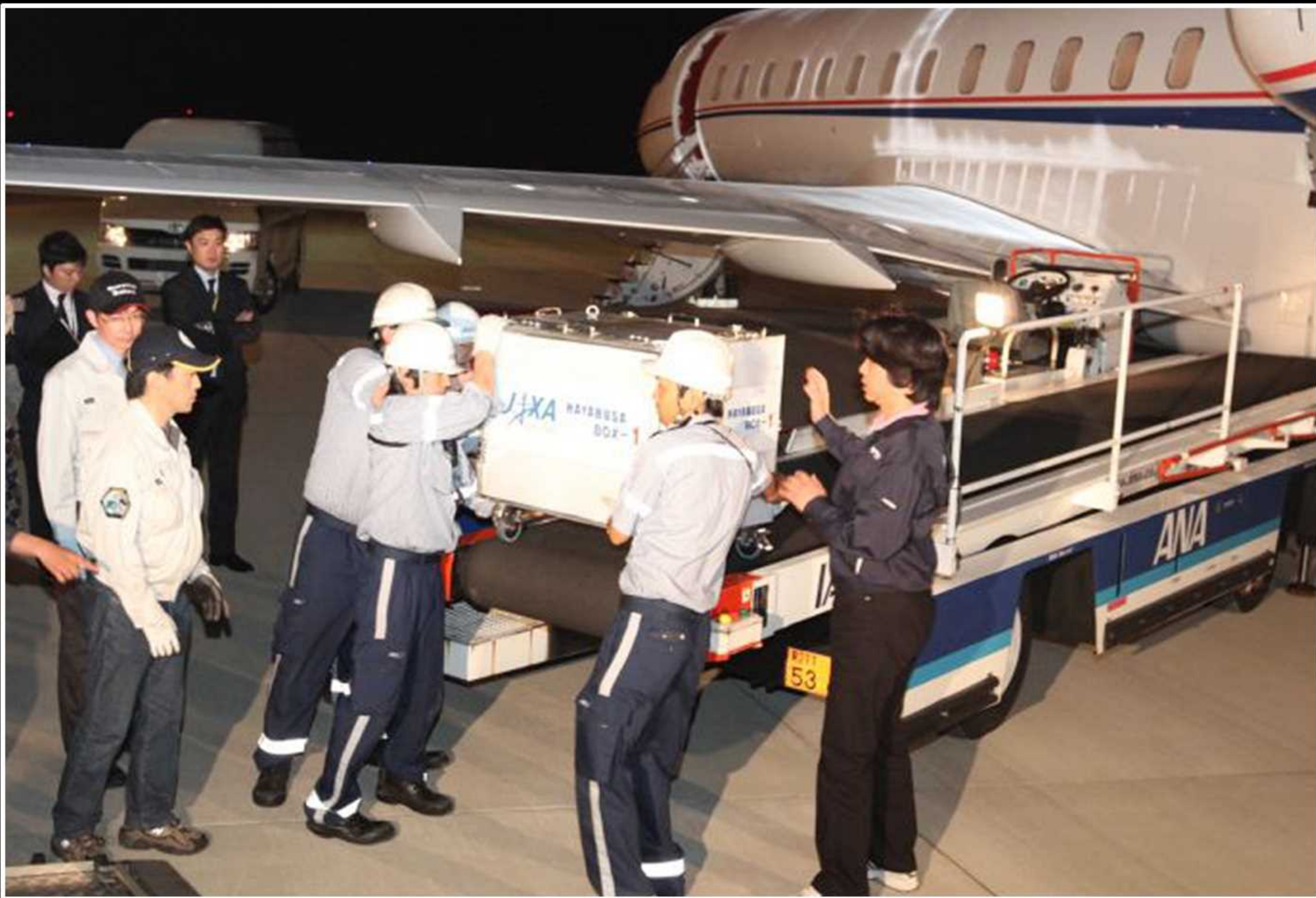
羽田空港にて インストゥルメント モジュールを搬出

7年間にわたる、はるか宇宙の旅で得られた貴重なデータ。 その搬送にも、ハンマーキャスターが活躍しています。